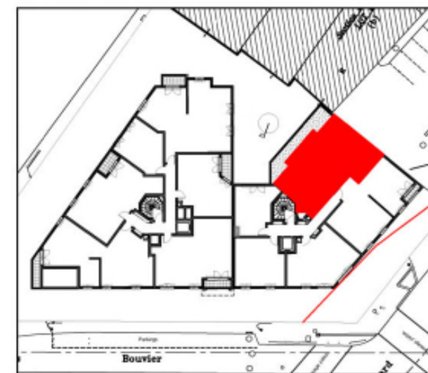
APPARTEMENT 3 PIECES 1ER ETAGE Appartement N° B11

NOTA: Le présent document exprime la figure et la disposition générale de l'appartement. Les emplacements des radiateurs et des convecteurs ne sont pas indiqués. Des modifications peuvent intervenir en fonction des nécessités techniques, des contraintes de la réalisation et/ou des impératifs réglementaires, tant en ce qui concerne les dimensions que les éléments d'équipements. Les surfaces indiquées sont approximatives. Les surfaces des placards sont incluses dans celles des pièces attenantes. L'évier indique la position des arrivées d'eau mais n'est pas fourni. Les trappes ainsi que les canalisations ne sont pas indiquées. Les retombées, les soffites et les faux-plafonds ne sont pas mentionnés sauf ceux éventuellement connus à la date d'établissement du présent plan. Attention, ce document est un plan de vente, il devra être substitué par un plan notaire lors de la signature du bien.