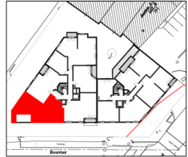
APPARTEMENT 3 PIECES 1ER ETAGE Appartement N° A15

NOTA : Le présent document exprime la figure et la disposition générale de l'appartement. Les emplacements des radiateurs et des convecteurs ne sont pas indiqués. Des modifications peuvent intervenir en fonction des nécessités techniques, des contraintes de la réalisation et/ou des impératifs réglementaires, tant en ce qui concerne les dimensions que les éléments d'équipements. Les surfaces indiquées sont approximatives. Les surfaces des placards sont incluses dans celles des pièces attenantes. L'évier indique la position des arrivées d'eau mais n'est pas fourni. Les trappes ainsi que les canalisations ne sont pas indiquées. Les rebambées, les soffites et les faux-plafonds ne sont pas mentionnés sauf ceux éventuellement connus à la date d'établissement du présent plan. Attention, ce document est un plan de vente, il devra être substitué par un plan notaire lors de la signature du bien.