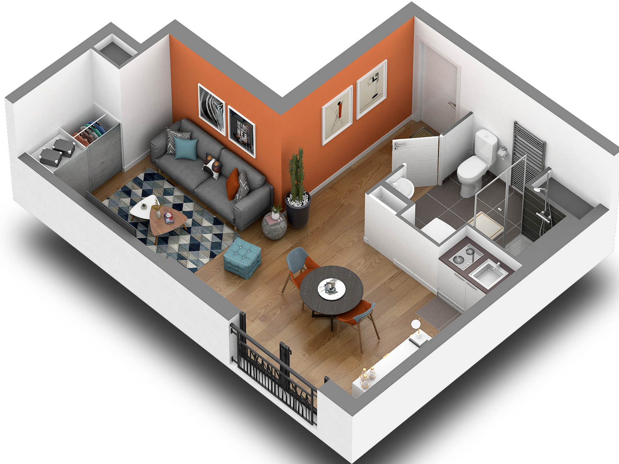
Plan non contractuel