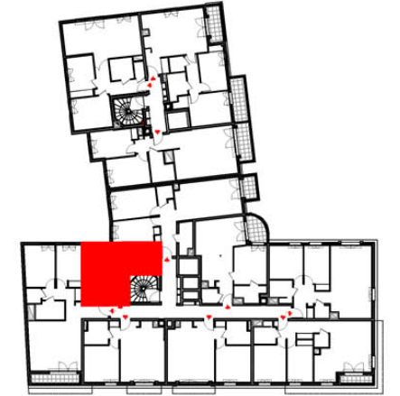
STUDIO 1 ER ETAGE Appartement N° A108

NOTA : Le présent document exprime la figure et la disposition générale de l'appartement. Les emplacements des radiateurs et des convecteurs ne sont pas indiqués. Des modifications peuvent intervenir en fonction des nécessités techniques, des contraintes de la réalisations et/ou des impératifs réglementaires, tant en ce qui concerne les dimensions que les éléments d'équipements. Les surfaces indiquées sont approximatives. Les surfaces des placards sont incluses dans celles des pièces attenantes. L'évier indique la position des arrivées d'eau mais n'est pas fourni. Les trappes ainsi que les canalisations ne sont pas indiquées. Les rebombées, les soffites et les faux-plafonds ne sont pas mentionnés sauf ceux éventuellement connus à la date d'établissement du présent plan. Attention, ce document est un plan de vente, il devra être substitué par un plan notaire lors de la signature du bien.